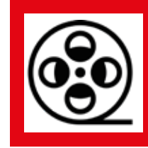
Cine y Entretenimiento