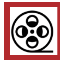
Cine y Entretenimiento